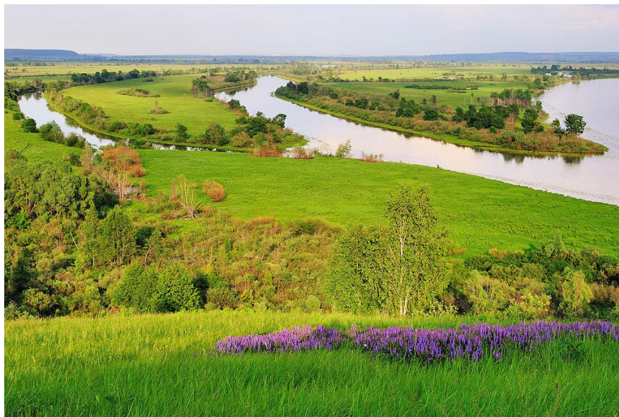
Национальный парк «Нижняя Кама»