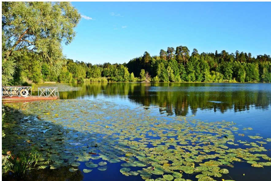
Волжско-Камский природный биосферный заповедник